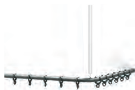
Duschvorhangstange Shower curtain rail

380 x 450 mm 7844 380 450 x 450 mm 7844 450