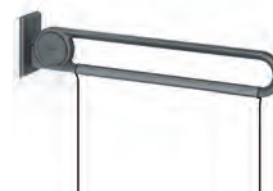
Duschspritzschutz Showerguard rail

900 x 900 mm 7381 090 1000 x 1000 mm 7381 100 1200 x 1200 mm 7381 120 1500 x 1500 mm 7381 150