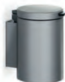
Abfallbehälter Waste bin

600 x 600 mm 0514 150 600 x 1000 mm 0514 170